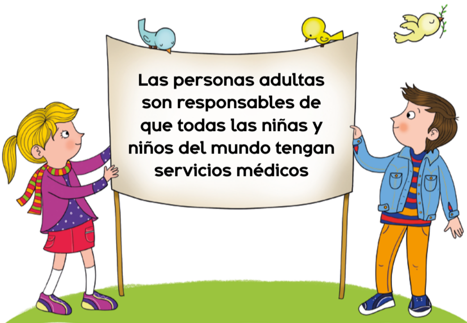
Ilustraciones de Inés Burgos.