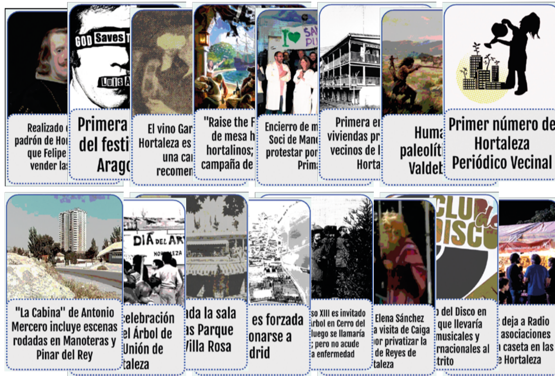
Algunas de las 150 cartas que componen el juego de mesa Tiempaleza de Juegos Si-Lo, que trata sobre la historia del distrito.

La plataforma local Juegos Si-Lo presenta su nueva creación, cuyo objetivo es descubrir de forma lúdica y participativa los acontecimientos que han contribuido a configurar durante siglos la Hortaleza actual