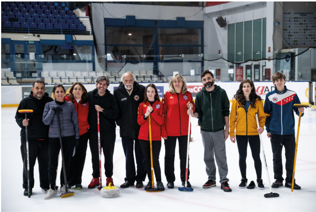
Miembros del B-52 Curling, en el Palacio de Hielo de Hortaleza, donde entrena el único club madrileño de esta disciplina. JAVIER PORTILLO

El B-52 es el único club de este deporte de invierno que resiste en Madrid y entrena en la pista del Palacio de Hielo, donde llegó a haber una quincena de equipos que se deshicieron por la crisis económica y el bloqueo institucional