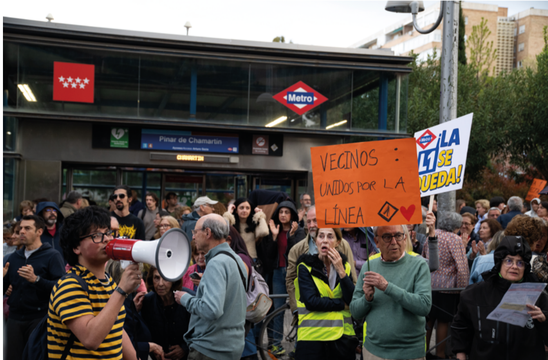
Vecinas y vecinos protestando contra el recorte de la Línea 1 de Metro en la calle Arturo Soria frente a la estación de Pinar de Chamartín el pasado 7 de abril. JAVIER PORTILLO

De esta forma, Madrid Nuevo Norte partirá desde Chamartín, donde conectará con las Líneas 1 y 10, y continuará su recorrido, avanzando unos tres kilómetros hacia el norte, con tres nuevas estaciones de Metro que, de forma provisional, se denominarán Centro de Negocios (futuro distrito financiero de Madrid Nuevo Norte), Fuencarral Sur y Fuencarral Norte (que cubrirán los nuevos barrios residenciales que se levantarán junto a las antiguas vías). A su vez, la Línea 4 se prolongará hasta la estación de Chamartín, conectando con la Línea 10 y con la red de trenes de larga distancia y de Cercanías. Las previsiones de la Comunidad de Madrid apuntan a que esta ampliación beneficiará a más de 175.000 usuarios diarios, que podrán desplazarse directamente desde el norte de la capital hasta enclaves estratégicos del centro como Sol, Gran Vía o Atocha. El presupuesto