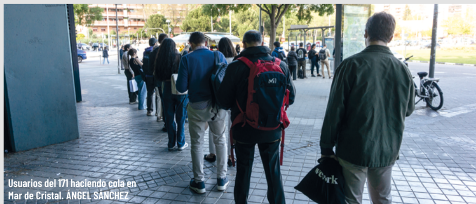
Usuarios del 171 haciendo cola en la parada del autobús 171. ÁNGEL SÁNCHEZ

Desde hace meses, resulta habitual al pasar por la glorieta de Mar de Cristal a primera hora de la mañana ver una larga cola de personas junto al centro comercial Gran Vía de Hortaleza y que tiene su cabecera en la parada del autobús 171, que conecta con Valdebebas. La mayoría son personas que trabajan en el nuevo barrio hortelino, en comercios, dotaciones o en alguna de las innumerables obras que se están ejecutando. “Desde que la Línea C10 de Cercanías no para en Valdebebas, ya nadie se baja en el intercambiador y los autobuses van llenos”, comentaba una usuaria a otra al ver que un coche se marchaba sin poder subir y le quedaban otros 40 minutos de espera. La asociación vecinal de Valdebebas confirma que a finales de febrero se sumó un nuevo coche, pero siguen sin cubrir la cada día más alta demanda de la línea.