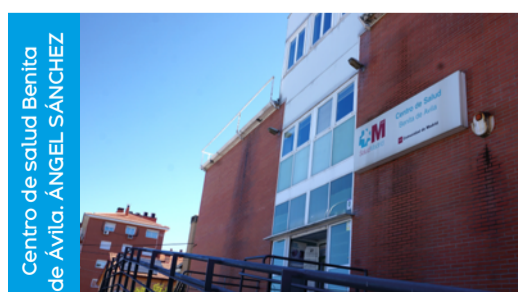
Centro de salud Benita de Ávila. ÁNGEL SÁNCHEZ