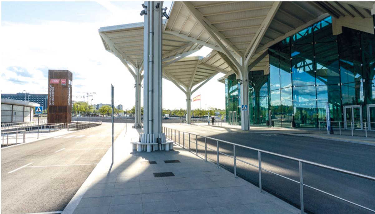
Entrada del intercambiador de Valdebebas, con la parada de taxis a la izquierda y la de los autobuses 828 y SE Ifema-Zendal a la derecha. ÁNGEL SÁNCHEZ

Año medio después de su inauguración, el nodo intermodal de Valdebebas tiene un tránsito muy reducido de viajeros desde que la Línea C10 de Cercanías no tiene parada en el barrio