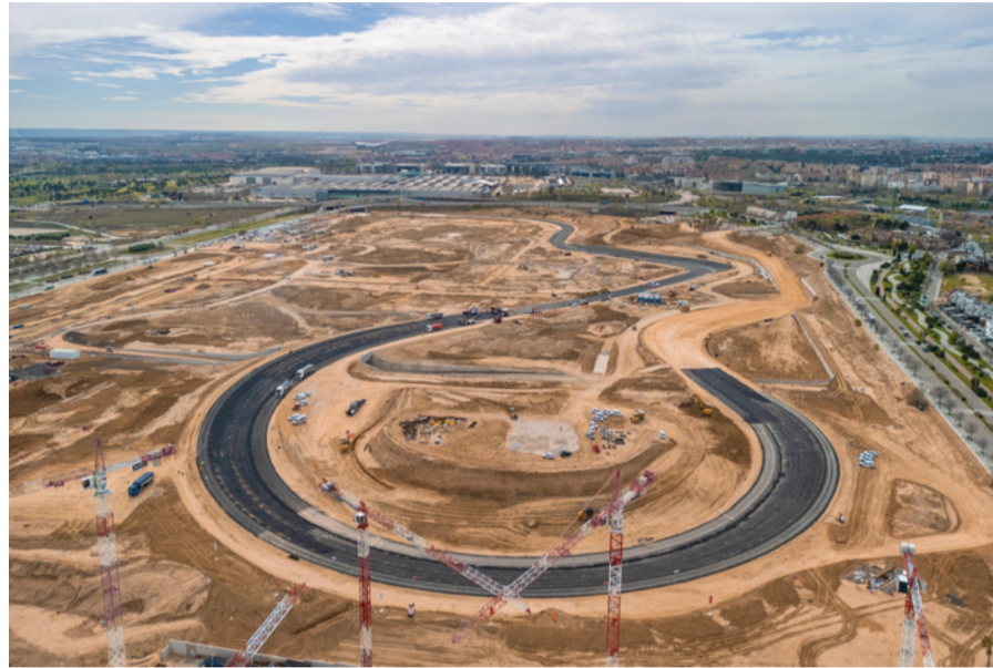
Estado actual de la curva 12 del circuito de Fórmula 1, conocida como La Monumental , tras su primera capa de asfaltado.

Aunque para poder ver más allá del esqueleto, todavía queda bastante, las obras están alcanzando un punto crítico con el comienzo del asfaltado del circuito. La curva 12, conocida como La Monumental , ya luce su primera capa de firme, para la que se han empleado 1.800 metros cúbicos de mezcla asfáltica, producida en Vicálvaro, y que ha requerido el trabajo de 80 personas y dos extendedoras de última generación. Una curva que promete espectáculo para los aficionados, pero