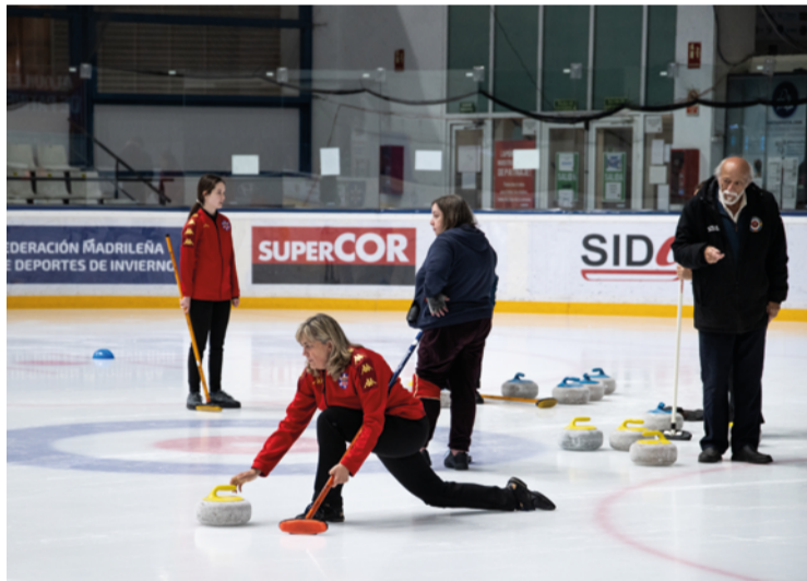
A la izquierda, el B-52 Curling tiene un equipo femenino sénior surgido entre las familiares del alumnado que acude al Palacio de Hielo. A la derecha, el B-52 Curling realiza varias jornadas de puertas abiertas al año en la pista del Palacio de Hielo. JAVIER PORTILLO