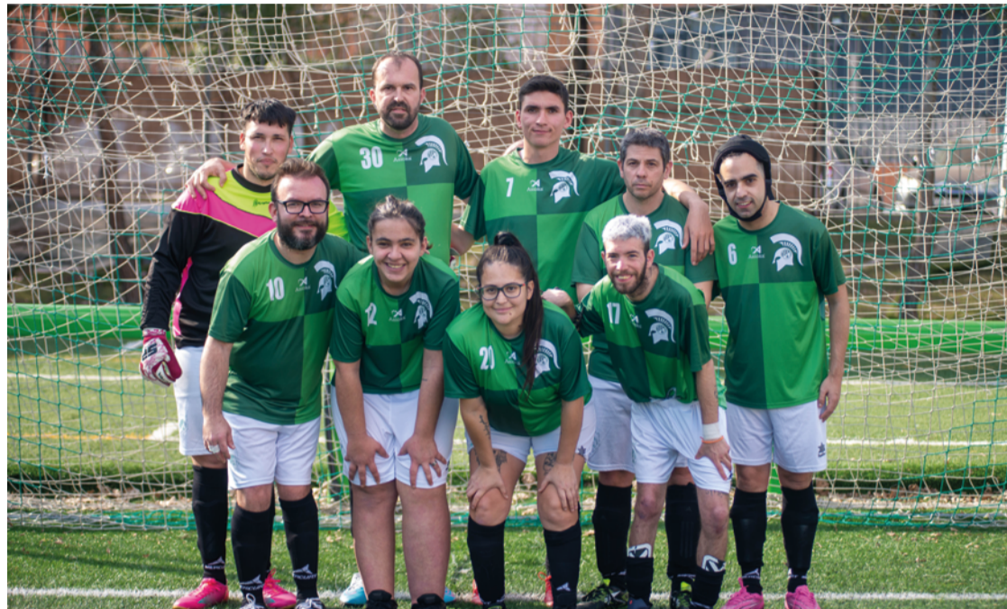
Miembros del Spartac PC, nuevo equipo del club deportivo manoterano integrado por jugadores y jugadoras con parálisis cerebral y daño cerebral adquirido. CD SPARTAC DE MANOTERAS

Tener un equipo PC es algo singular y caro. El Spartac PC compete en la liga autonómica y en la Segunda División de España. Todo esto conlleva una infraestructura más compleja de viajes, aloja-