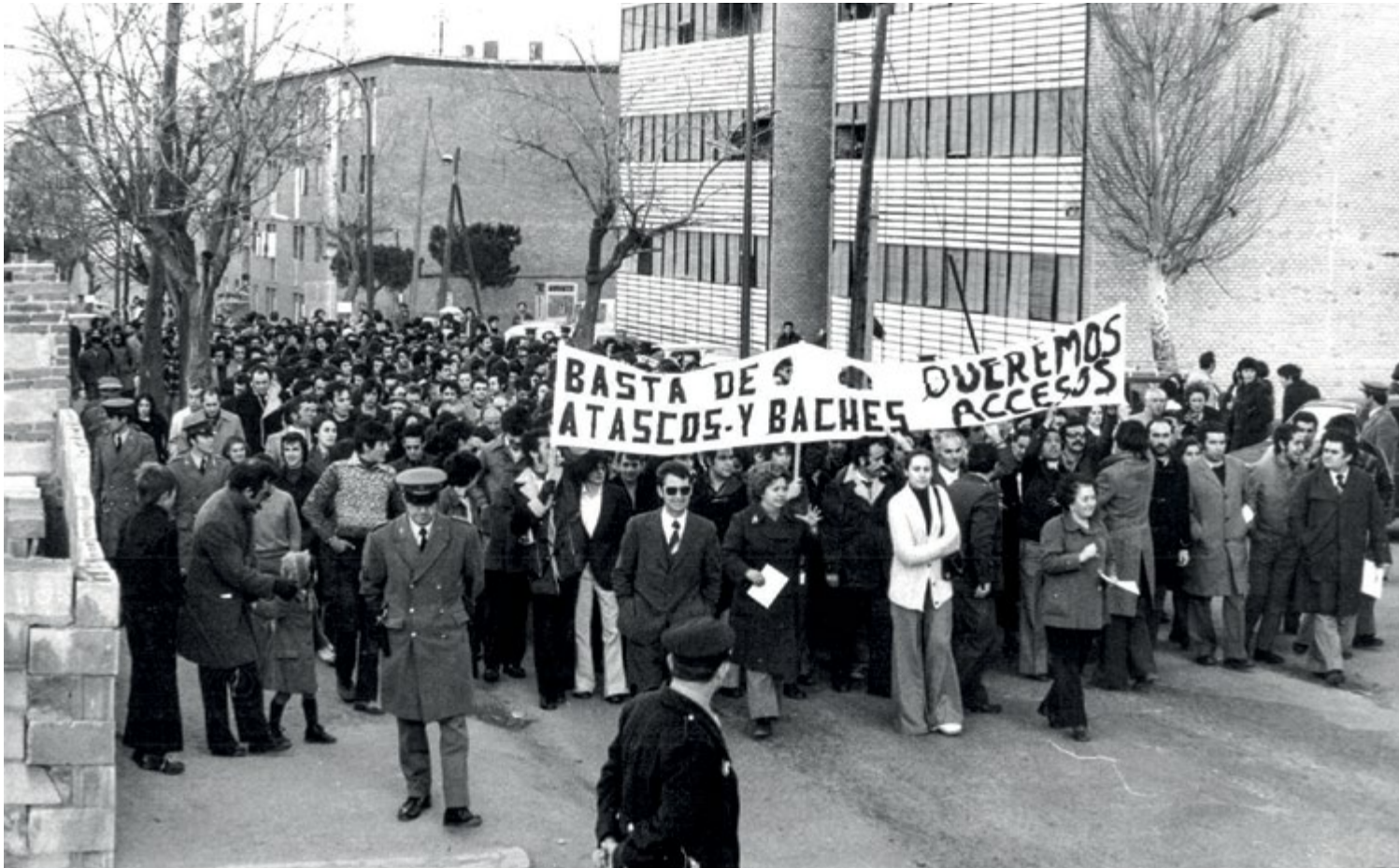
La manifestación del 13 de marzo de 1976, en la carretera de Canillas a la altura del cruce con la calle Méndrida.

El incipiente tejido vecinal consiguió permiso para manifestarse contra el pésimo estado de la carretera de Canillas el 13 de marzo de 1976. Fue la primera protesta autorizada en Madrid tras la muerte de Franco