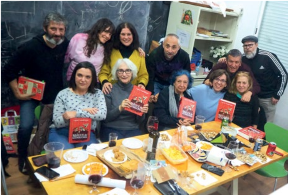
Miembros del club de lectura Días de Vino y Cómic reunidos en la Soci de Manoterías.

Si existiera una herramienta para crear cartografías de afectos, podría generarse un mapa en el que el distrito de Hortaleza apareciera trufado de puntos luminosos. Tendríamos ante nosotros una constelación formada de asociaciones, colectivos, clubes y grupos de seguidores de las más variadas disciplinas. Uno de estos puntos brillaría con un fulgor especial: el club de lectura Días de Vino y Cómic, que nació, como muchas otras cosas buenas, durante una tarde de agitación cultural frente a una mesa compartida por integrantes y amigos de Kulture Market. Fue así como un grupo de amantes de la lectura y, en especial, de los cómics se reunieron en el local de la asociación vecinal del barrio, la Soci de Manoterías, un 2 de febrero de 2024 para intercambiar reflexiones, opiniones, perspectivas y divagaciones en torno al cómic. “El primero que comentamos fue El