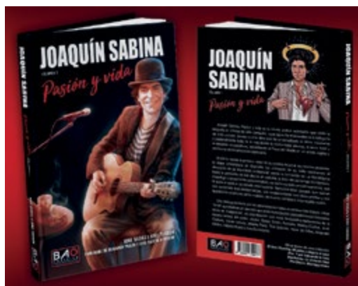
‘Joaquín Sabina. Pasión y vida’, última biografía en formato de novela gráfica de los Kikes.

“Puedes ser absolutamente fiel al devenir de su biografía y, a la par, meterle fabulosas dosis de imaginación”