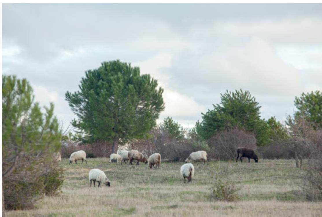
Arriba, una decena de ovejas pastando en el parque forestal de Valdebebas. A la derecha, cartel informativo en la valla que rodea la zona donde se ubican las ovejas.

Hortaleza recibe a 15 nuevas vecinas ovinas que se han asentado en el parque forestal como parte de un estudio impulsado por el Ayuntamiento de Madrid sobre el pastoreo controlado