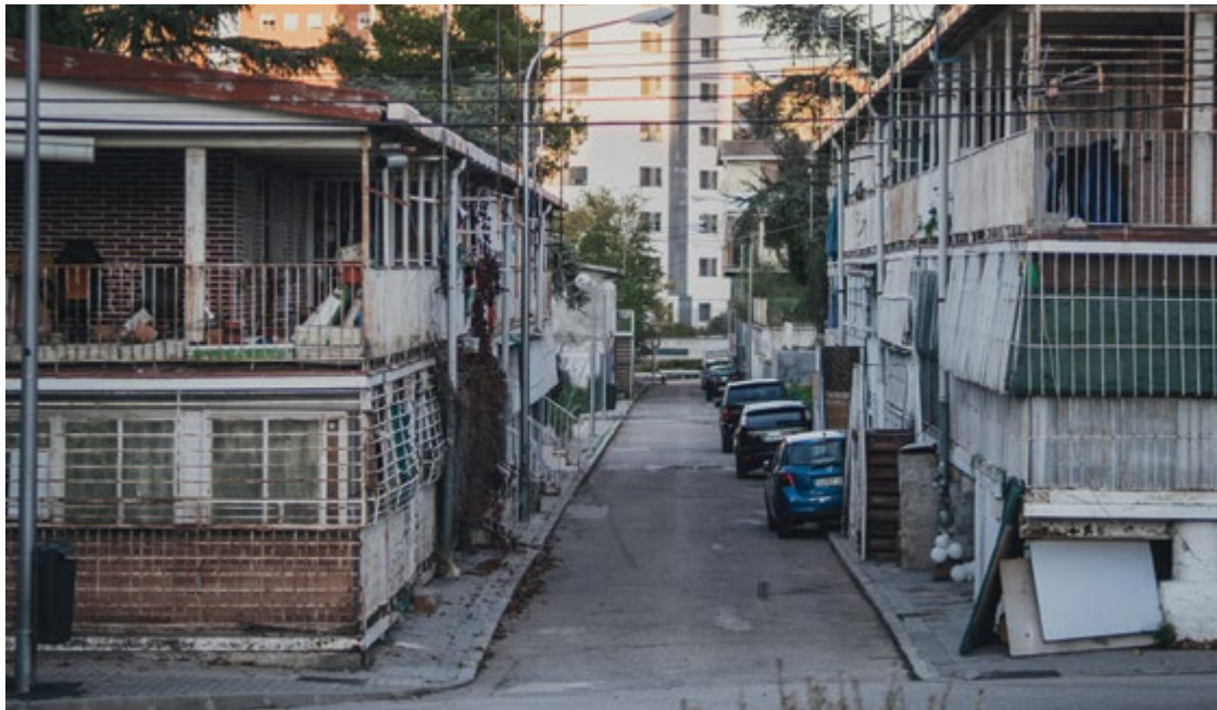
Una de las calles de la UVA de Hortaleza ubicada dentro de la zona que se va a urbanizar.

El Gobierno regional invertirá 6,4 millones en urbanizar las calles del barrio como paso previo a la construcción de las últimas 272 viviendas y a los realojos pendientes en la UVA de Hortaleza