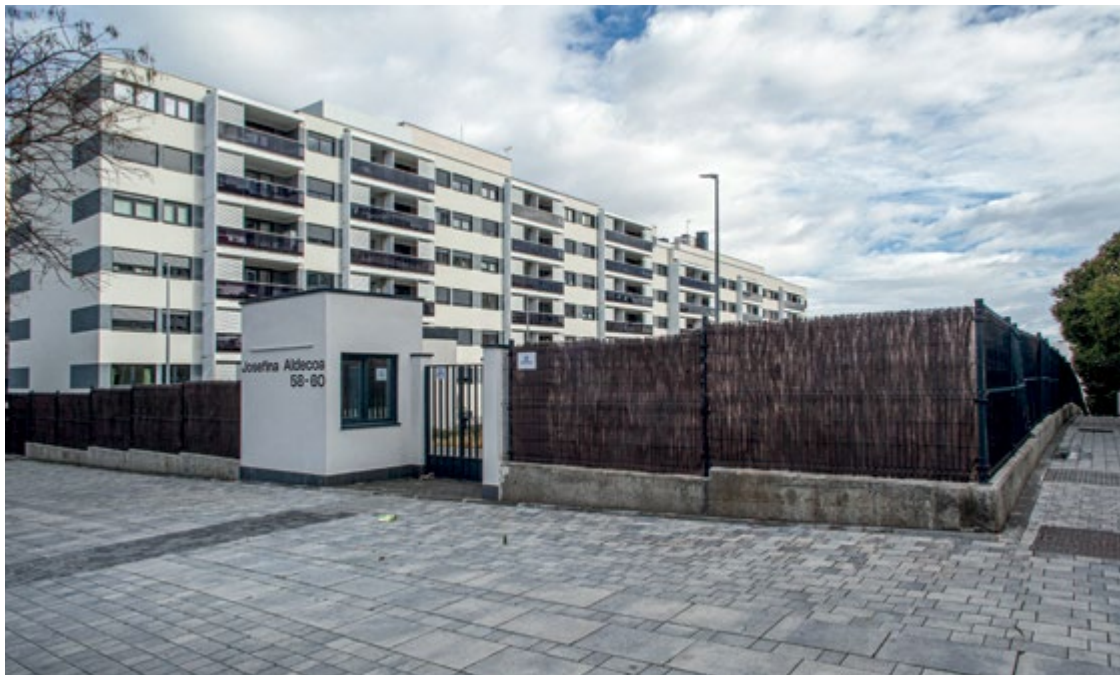
Edificios del Plan Vive en la calle Josefina Aldecoa, números 58-60, en el barrio de Valdebebas. MARÍA ROLDÁN

Los inquilinos de las viviendas del plan de alquiler asequible de la Comunidad de Madrid en el barrio de Valdebebas denuncian “irregularidades y deficiencias graves en la gestión”, pese a los altos precios