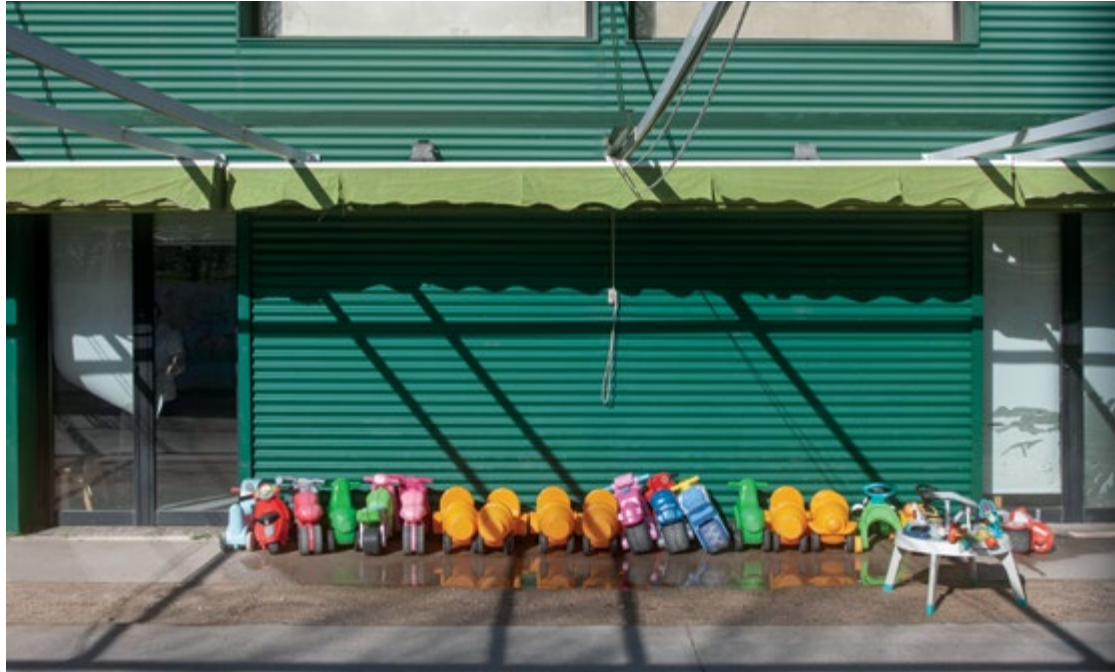
Motos de juguete aparcadas en el patio de la escuela infantil Doña Francisquita.