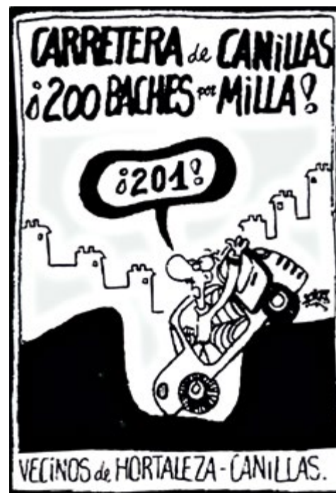
Pegatina diseñada por Antonio Fraguas, 'Forges'.

Pero insospechadamente (sobre todo teniendo en cuenta los meses previos de huelgas en metro,