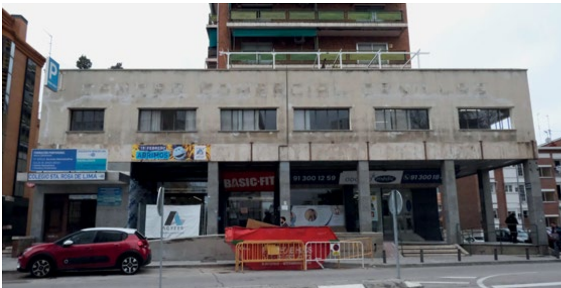
El cartel de Centro Comercial Canillas desapareció a finales del pasado mes de enero. JULIA MANSO

Desde ese último día de junio, las obras para acondicionar el espacio a las necesidades de sus nuevos propietarios no han parado. Aunque muchos eran los rumores que corrían por el barrio, nada se sabía de en qué se iba a convertir la Galería de Alimentación Canillas hasta que el pasado mes de enero