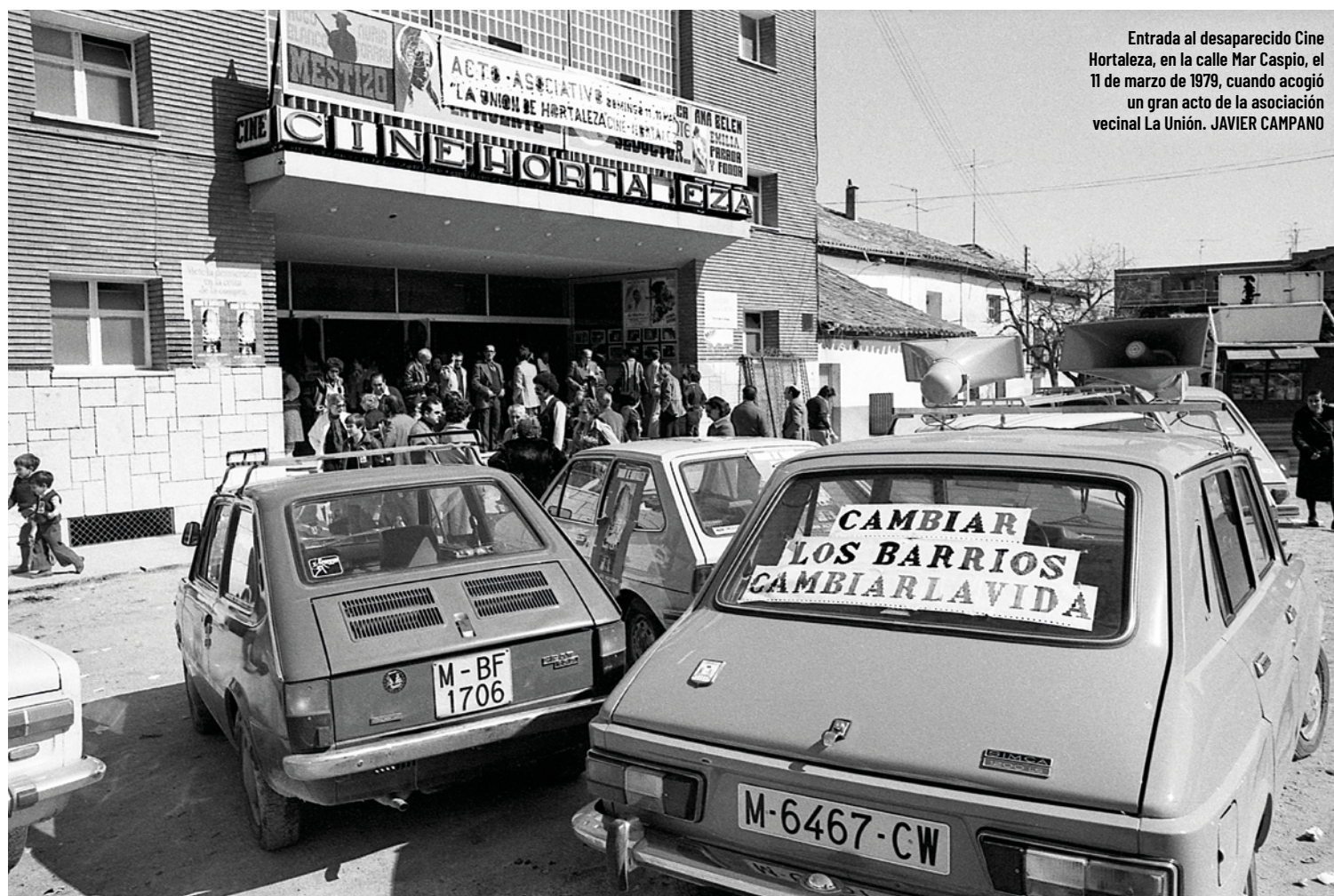
Entrada al desaparecido Cine Hortaleza, en la calle Mar Caspio, el 11 de marzo de 1979, cuando acogió un gran acto de la asociación vecinal La Unión.