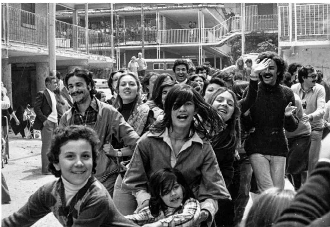
Vecinos y vecinas bailan la conga en una de las fiestas del barrio de la UVA de Hortaleza celebradas a finales de los años setenta.

El permiso para la manifestación lo solicitó Marta Hidalgo en nombre de la asociación Amas de Hogar de Esperanza. Nadie sabía que pertenecía, además, al Partido Comunista de España (PCE). “El delegado del Movimiento, al darnos los papeles, sacó una pistola del cajón y nos dijo: espero que no la tenga que utilizar con ustedes, que ya sé cómo se las gastan”, recuerda Marta, que sitúa los orígenes de la asociación en una manifestación de mujeres y niños en octubre de 1973 por la falta de calefacción en las casas del barrio de Esperanza. Las asociaciones de amas de casa del distrito desarrollaron un gran trabajo en tiempos todavía difíciles para las mujeres. La de Hortaleza solicitó los permisos para las cabalgatas de Reyes de 1976 y 1977 junto a La Unión. El machismo, desde el mismísimo uso del lenguaje, seguía muy presente en la sociedad. Las propias asociaciones de vecinos no cambiaron su nombre