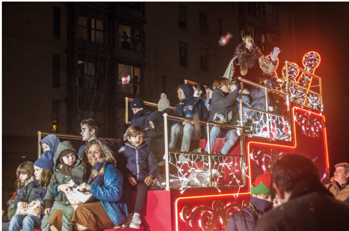
Carroza del rey Gaspar en la cabalgata de Sanchinarro, celebrada el 3 de enero de 2025. MARÍA ROLDÁN

2024, apenas unos días antes de la celebración de la Cabalgata de Sanchinarro, de la que presumió David Pérez en la red social X respondiendo a diferentes usuarios que criticaron el despliegue