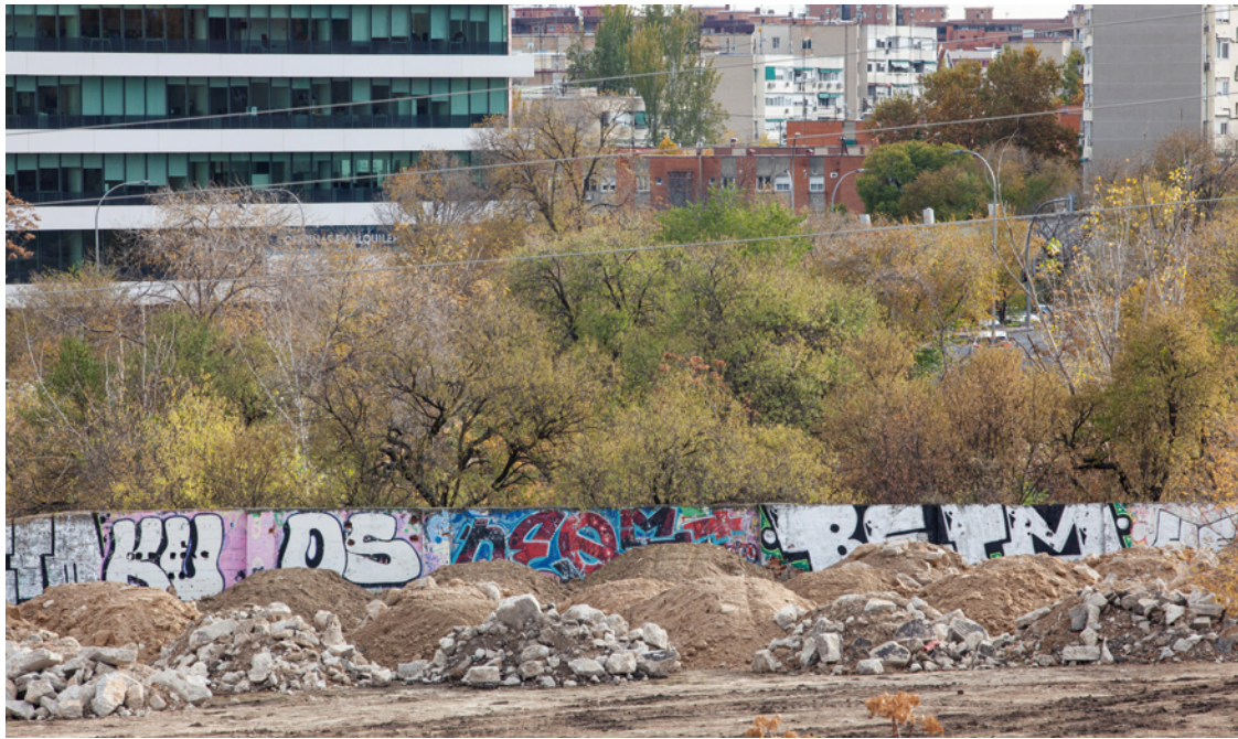
Montículos de escombros junto a las tapias de Huerta de Mena, finca histórica del siglo XVIII. MARÍA ROLDÁN PAZOS

Un camión vierte de forma impune toneladas de cascotes y tierras en la parcela aledaña a Huerta de Mena, la centenaria finca de Los Almendros, ante la inacción del Consistorio