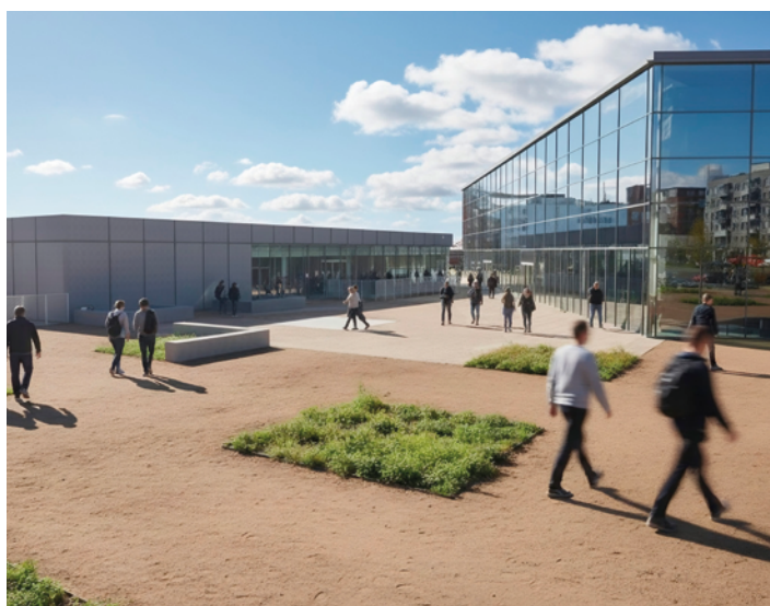
Recreación del futuro pabellón deportivo municipal en Sanchinarro.

Los trabajos serán ejecutados por el Área de Obras y Equipamientos y cuentan con un presupuesto base de licitación de 10 millones de euros. La dotación estará ubicada en la calle Oña número 18 y tendrá una superficie construida de más de 4.200 metros cuadrados, que “se dividirá en dos volúmenes unidos entre sí bajo rasante mediante un patio inglés que permitirá la entrada de luz natural y ventilación”. Por