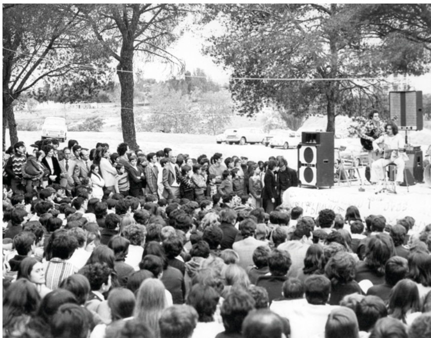
Concierto en las fiestas de primavera de 1978 organizadas por la asociación La Unión de Hortaleza en el barrio de la UVA de Hortaleza.