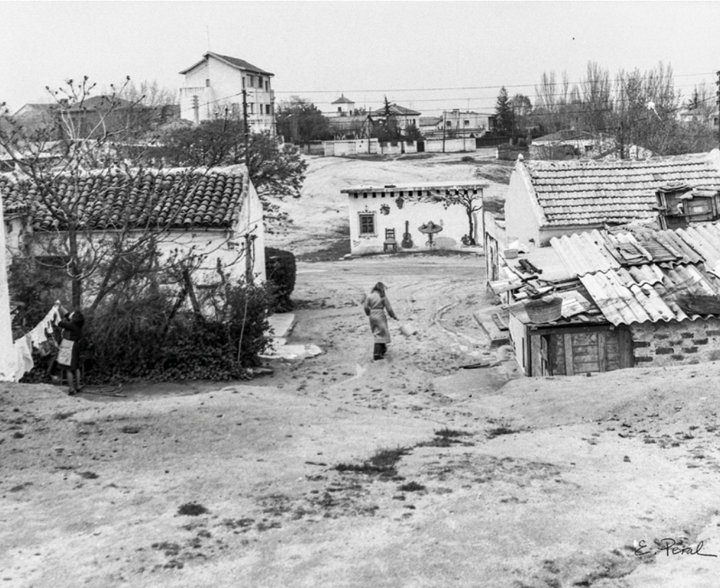
Una mujer camina por las calles sin asfaltar del barrio de Portugalete, con algunos de los famosos murales pintados en 1975.