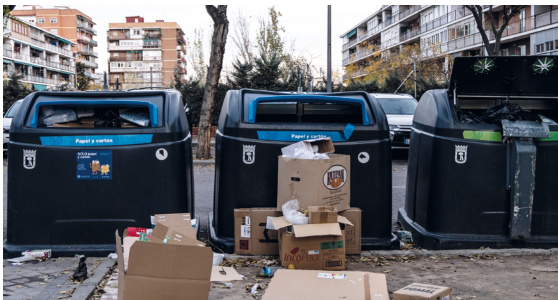
Cubos de basura de papel y vidrio en la calle Mar Menor. SANDRA BLANCO

El debate público se ha centrado en la fórmula utilizada para realizar el cálculo de la cuantía final para cada domicilio y en la reducción del impuesto de bienes inmuebles (IBI), cuya cuantía debería ser equivalente al coste de la nueva tasa. La fórmula se compone de una parte fija, que tiene que ver con el valor catastral del inmueble, y una parte variable, que tiene que ver con la cantidad de residuos que se genera en cada barrio y el nivel de separación correcta de los residuos. En el caso de Madrid, la fórmula elegida para calcular la tasa da mayor