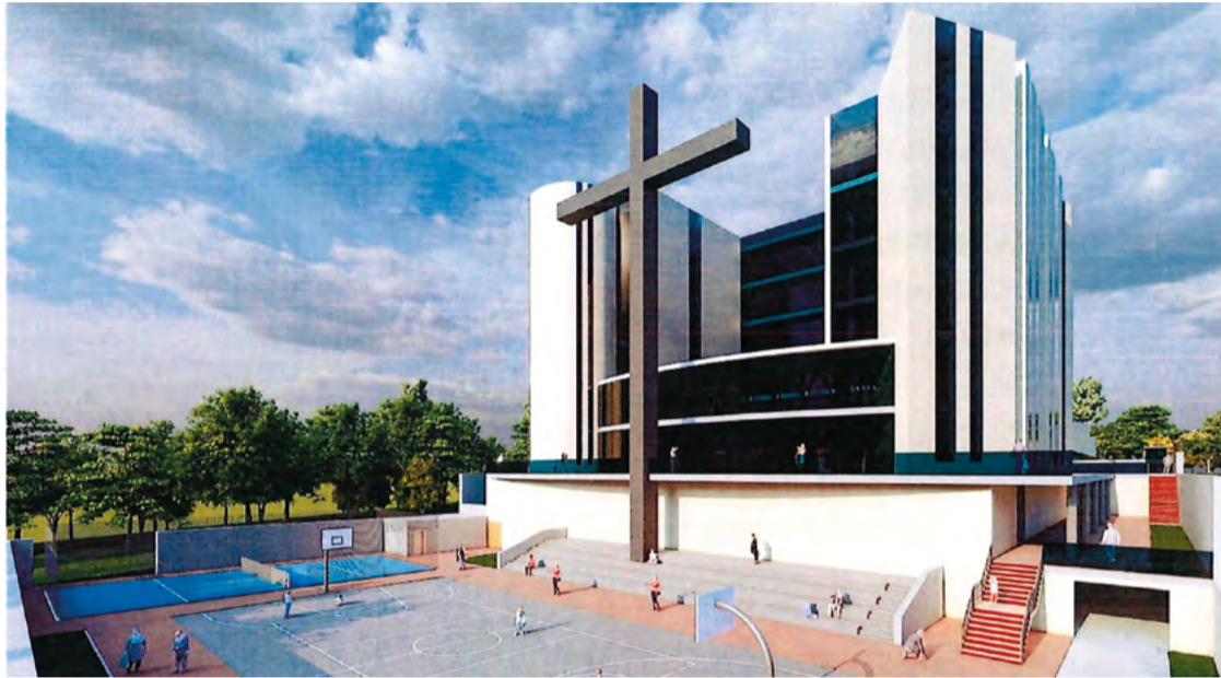
Recreación de la entrada de la construcción en el anteproyecto presentado por el Arzobispado de Madrid para la parcela de Valdebebas. @HILOSVALDEBEBAS

El anteproyecto presentado por la Archidiócesis de Madrid para optar a la concesión incluye, además del templo, dos torres de seis plantas y dos niveles de sótano con aparcamiento, salón de actos y cafetería, así como pistas de baloncesto y de pádel