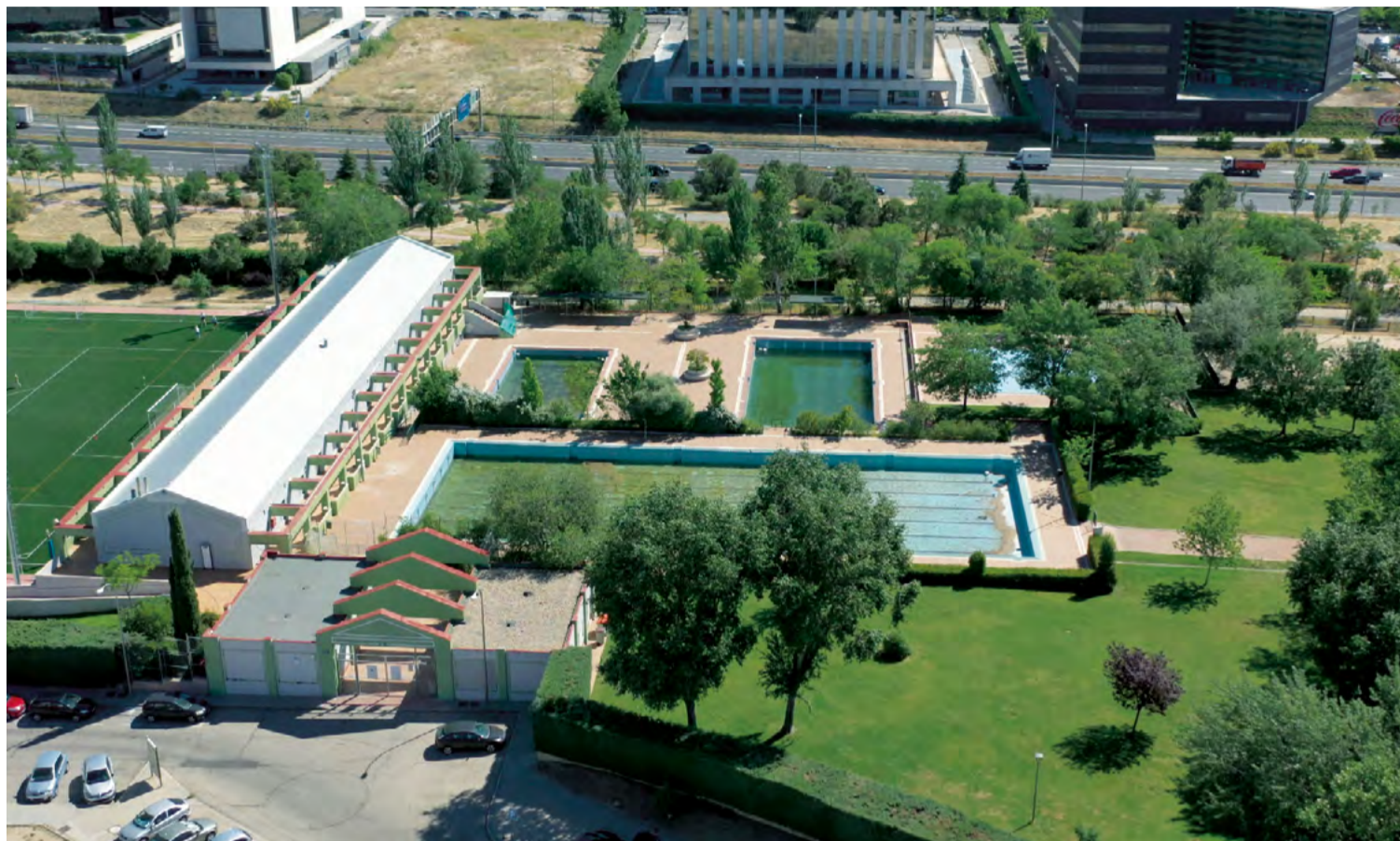
Imagen aérea de las piscinas del polideportivo Luis Aragonés cerradas por obras en 2022.

El vecindario de Hortaleza solo tendrá la mitad de sus piscinas al aire libre abiertas los meses estivales: las del polideportivo Luis Aragonés se clausuran por la reforma en su vaso olímpico