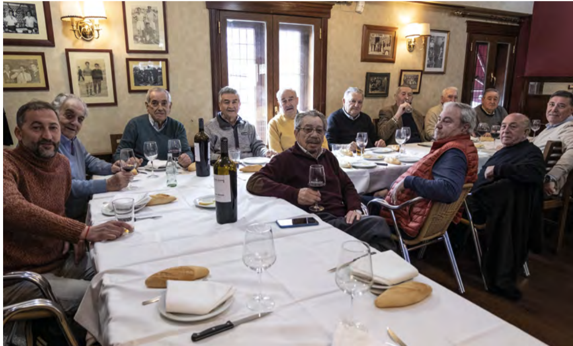
Asistentes a la comida en Casa Florencio el pasado 24 de febrero por el día de San Matías. SANDRA BLANCO

Los originarios del antiguo pueblo siguen celebrando el día de su patrón reuniéndose a comer y a recordar en una mesa de Casa Florencio, y esa conversación se convierte en una lección de historia