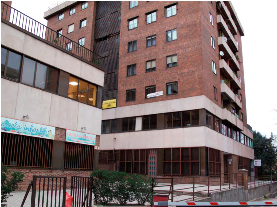
El vecindario del número 27 de la calle Toronga pide "control municipal" ante las obras de la primera planta destinada a oficinas. JULIA MANSO

Este periódico se ha puesto en contacto con Dapamali Works y se han negado a contestar preguntas.