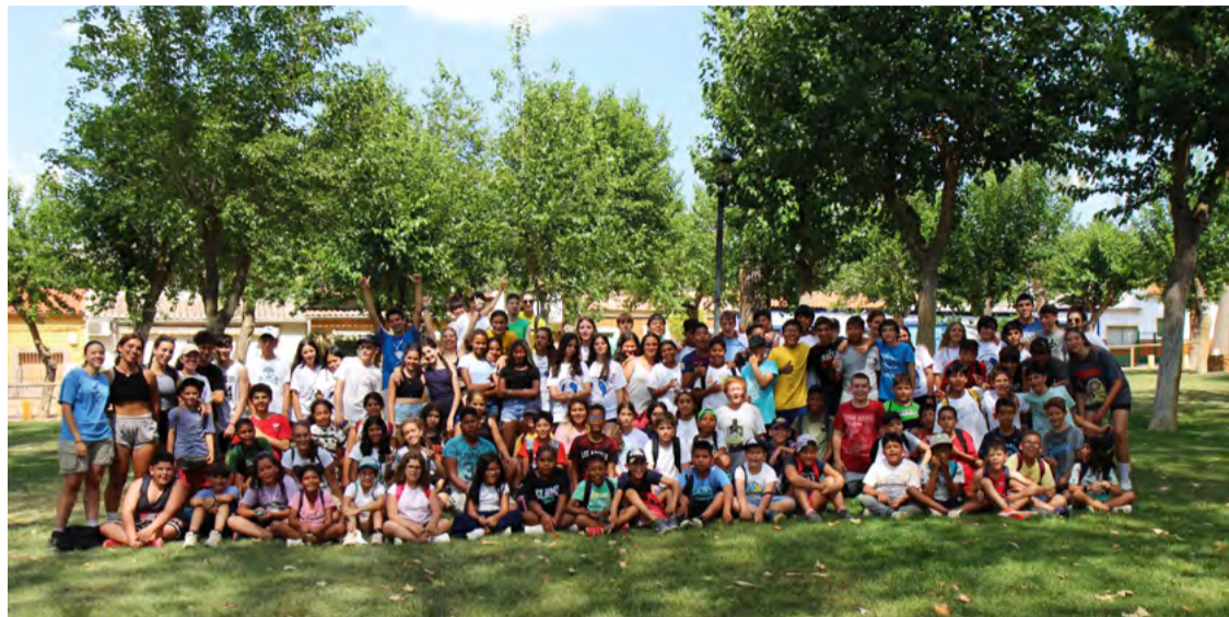
Campamento de verano 2023 de La Torre de Hortaleza.

La asociación conmemora su labor de integración social de niñas, niños y jóvenes del distrito a través del deporte con una nueva edición de su ya tradicional torneo anual de baloncesto, denominado 'Fiesta de la Torre por la Convivencia'