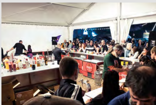
Ambiente en la Caseta del Barrio en las Fiestas.