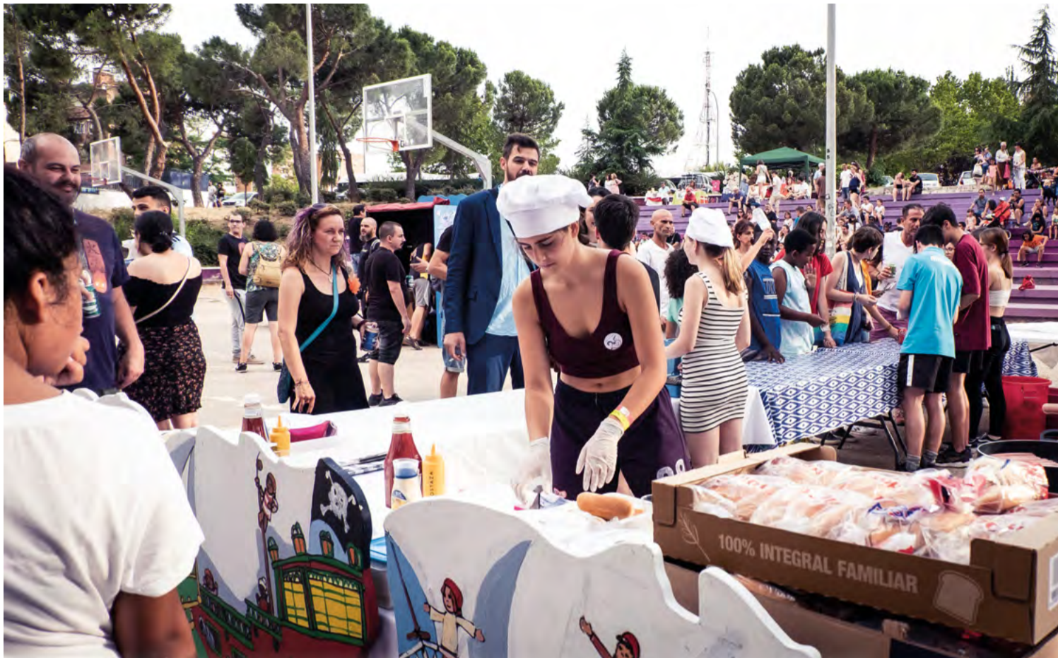
Vecinas voluntarias atienden en la barra de las fiestas vecinales del barrio de Manoterías, uno de los eventos en los que se ha prohibido el alcohol. SANDRA BLANCO