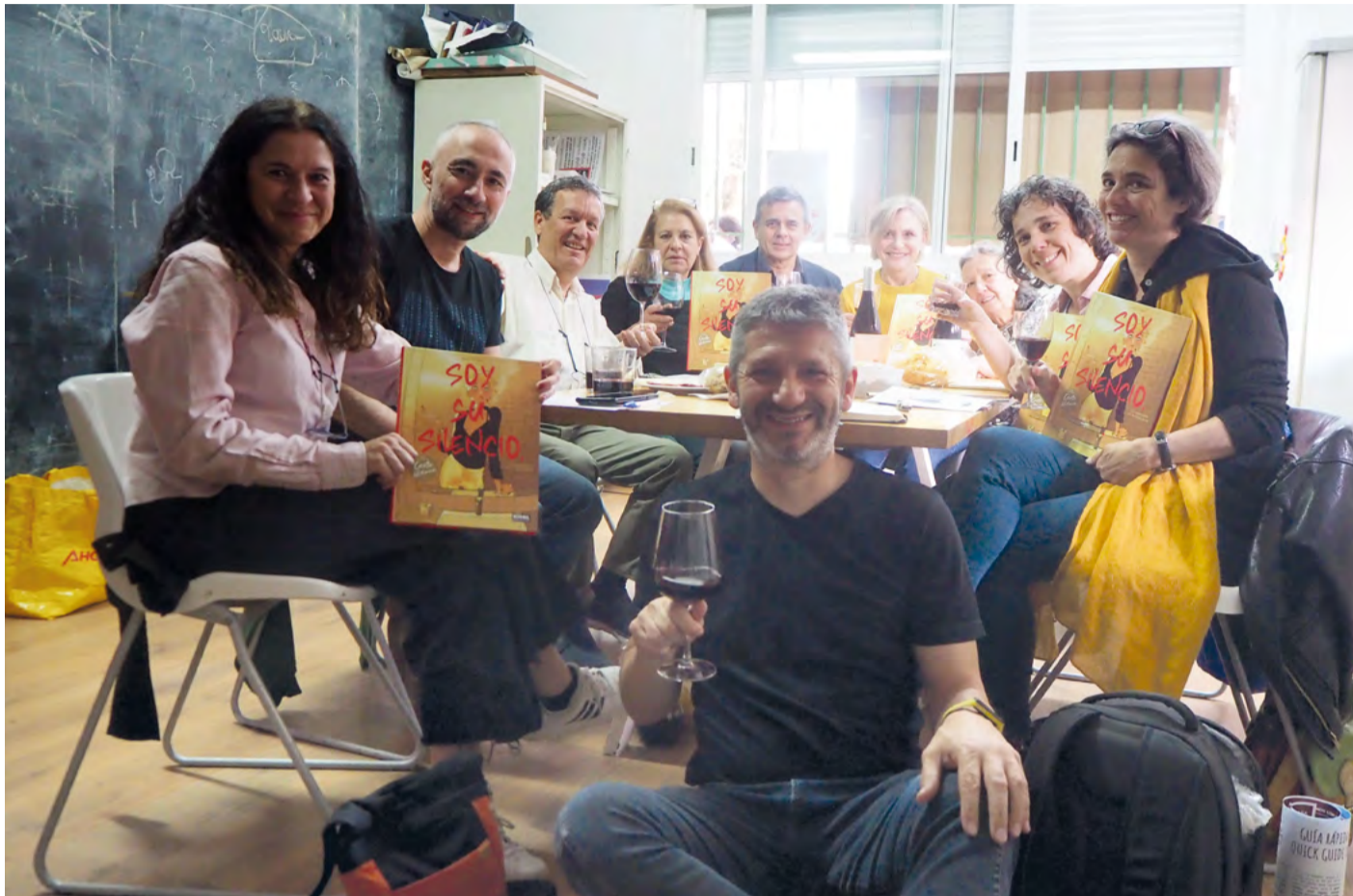
Días de vino y cómics, club de lectura organizado por Kulture Market. MANOTERAS TE ENFOCA

Con motivo del 23 de abril, las tres bibliotecas públicas y la mayoría de los clubes de lectura del distrito celebran junto al vecindario el "Encuentro de la comunidad lectora de Hortaleza"