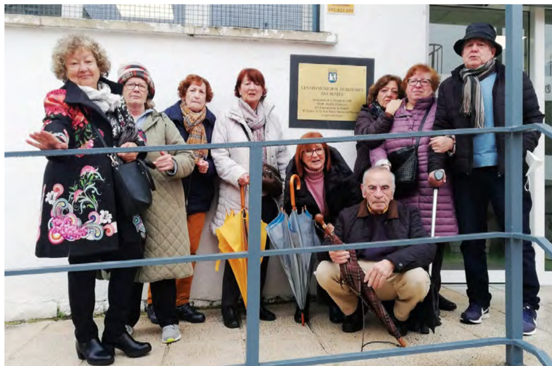
Miembros de la junta directiva de la asociación del Centro Municipal de Mayores San Benito.

Algo imposible si la empresa adjudicataria del servicio, Aebia Tecnología y Servicios, dejaba durante todo el trimestre sin talleres de baile y variedades a más de cien personas, lo que se percibía como que “se está riendo de nosotros y