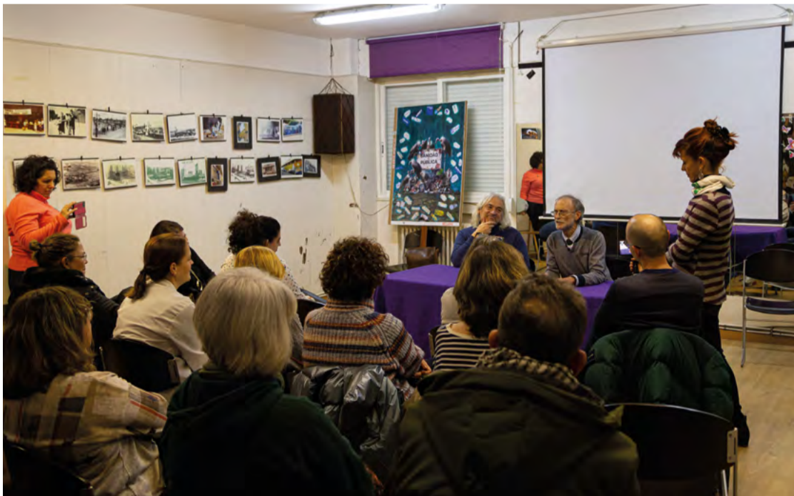
Charla debate en la celebración del aniversario del encierro de médicos y pediatras en la Soci de Manoteras. ANTONIO GARCÍA-MANOTERAS TE ENFOCA

Los médicos y pediatras de Atención Primaria se reencuentran en Manoteras para celebrar el aniversario de su encierro en defensa por la sanidad pública