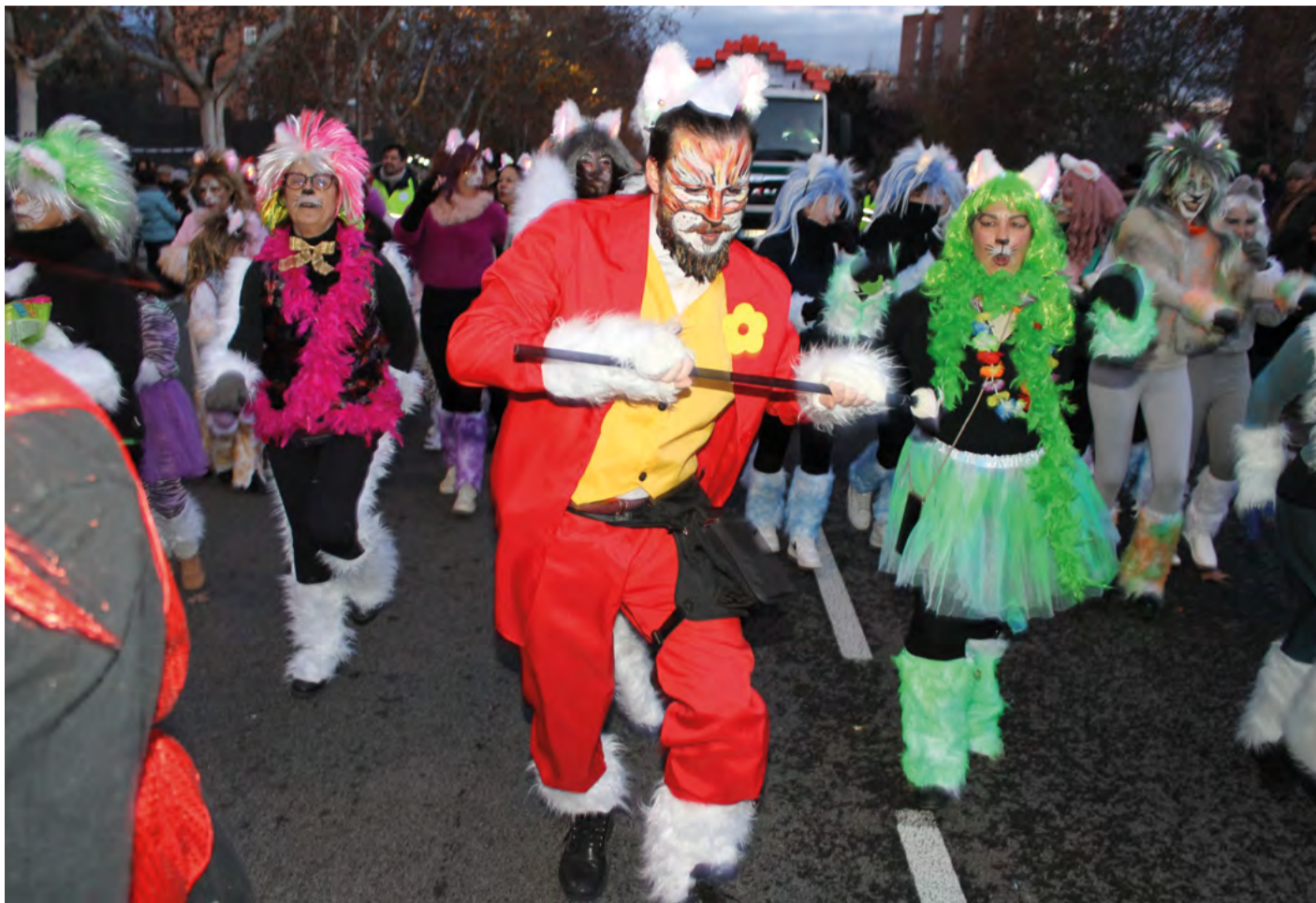
El grupo de swing de Danos Tiempo hizo un pasacalles de los Aristogatos en la Cabalgata de Hortaleza 2024. TASIO PEÑA