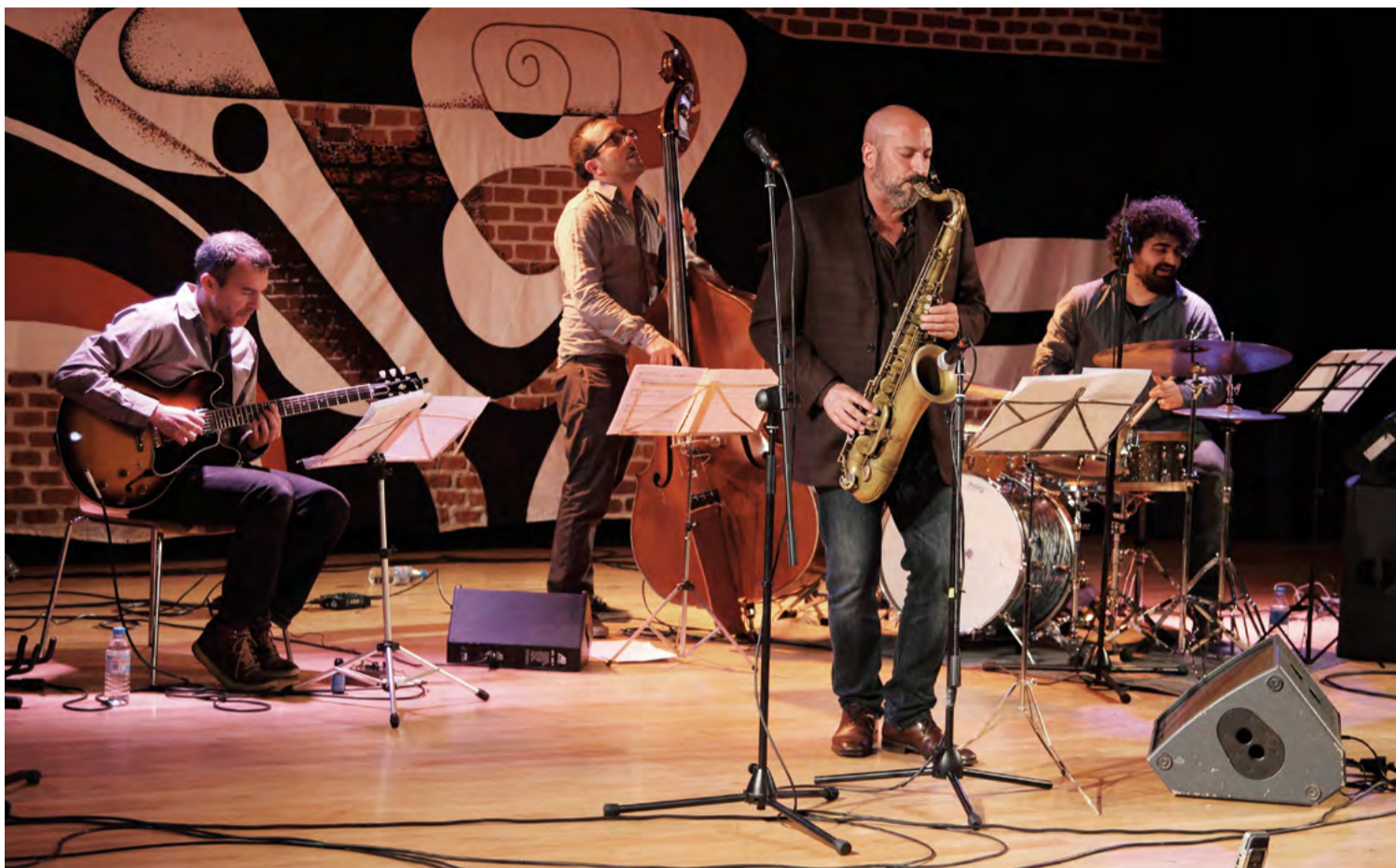
Momento de la actuación del saxofonista neoyorquino Bob Sands en febrero de 2016, con el mural de Arcadio Blasco al fondo. SANTI MARTÍNEZ