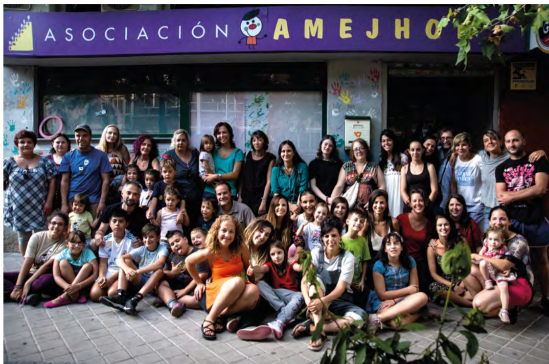
Educadoras y familias de Amejhor, juntas y revueltas, delante del local de la asociación de la calle Abizanda en 2018. SANDRA BLANCO

Fundada en 1978 y dedicada durante décadas a los niños y niñas de la UVA de Hortaleza, la entidad anuncia su disolución por falta de relevo, una situación que comprometía su proyecto educativo, que estaba sostenido con trabajo voluntario