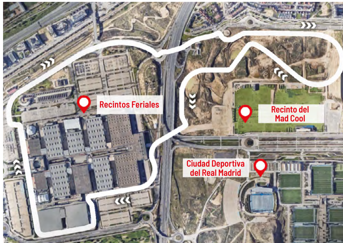
Trazado del futuro circuito del Gran Premio de España de Fórmula 1 proyectado por Ifema.

Los bólidos pasarán a gran velocidad por vías públicas junto a viviendas de Las Cárcavas