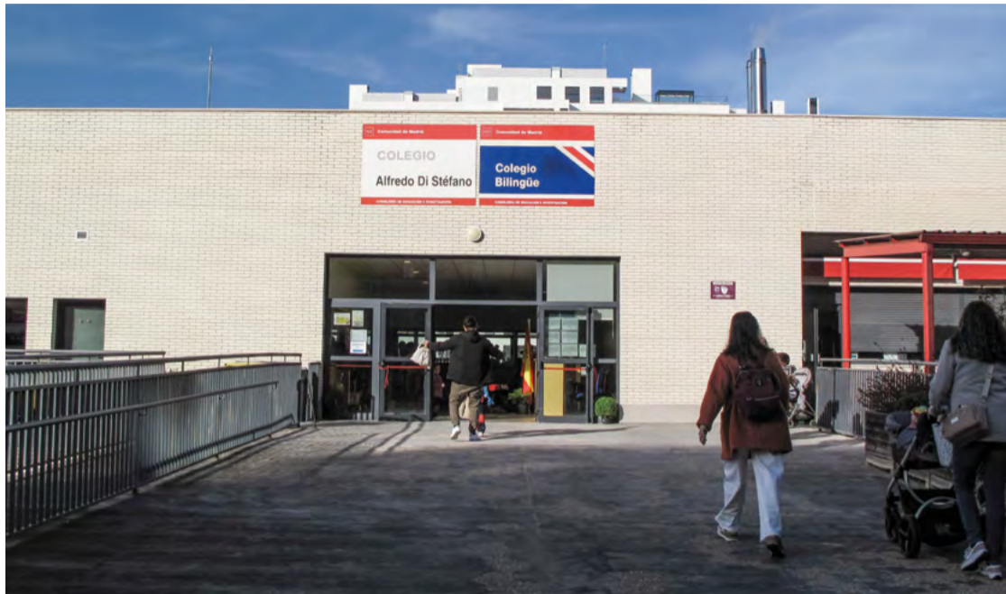
Entrada al colegio público Alfredo Di Stéfano.

Además, adelantó que el colegio concertado Gredos San Diego, que tiene un centro en Valdebebas, “abrirá este año cuatro aulas de Secundaria para el primer curso y otras cuatro para el segundo”.