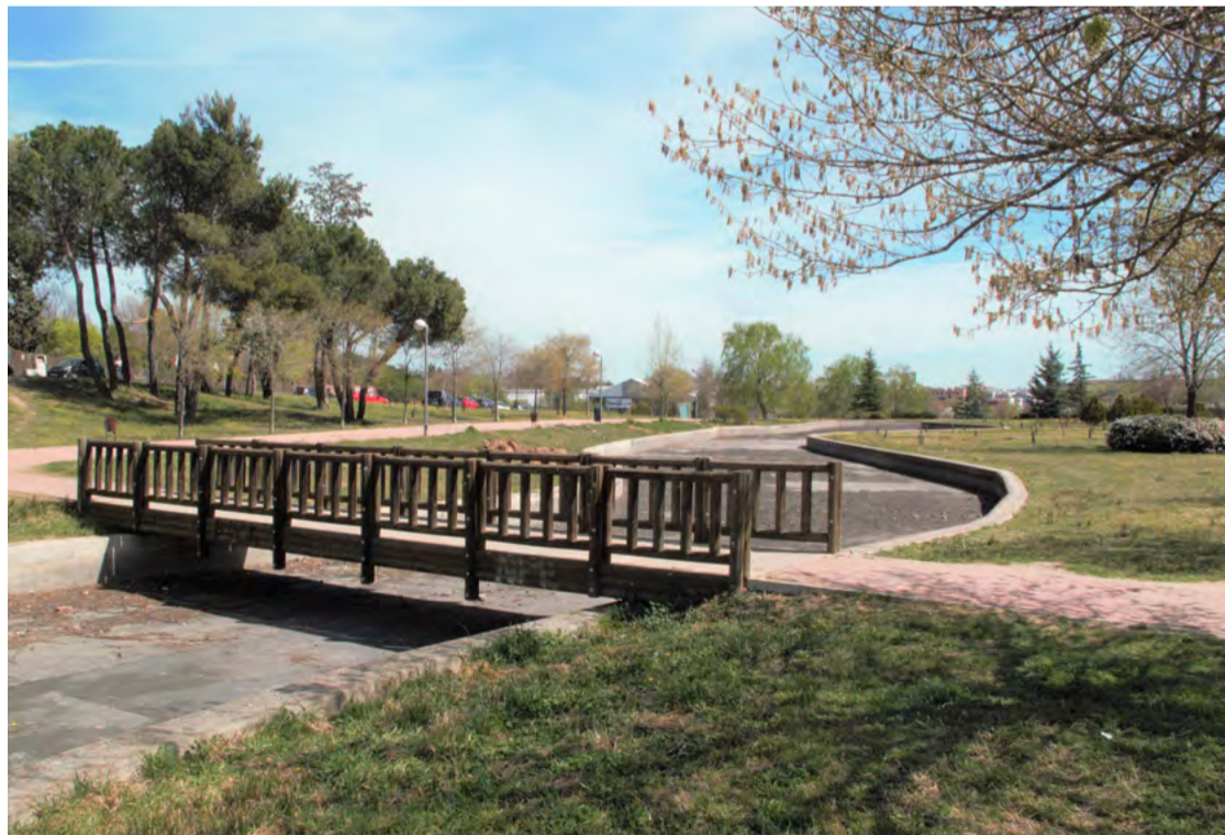
El parque de la ría de Sanchinarro, con el cauce seco.