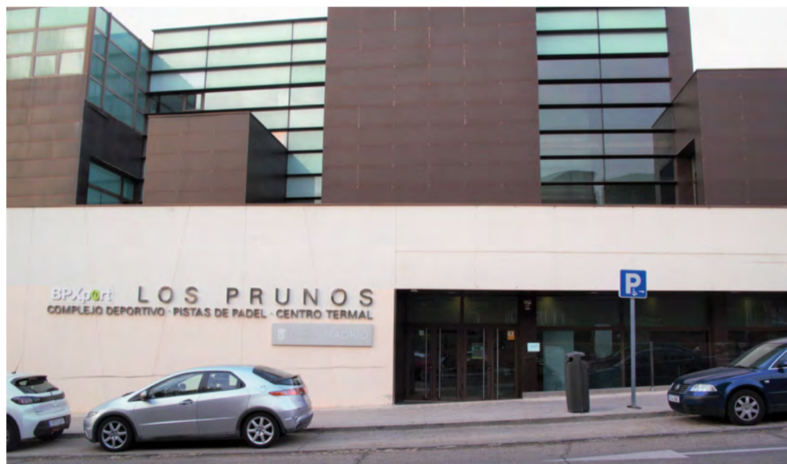
Entrada del centro deportivo municipal Los Prunos. JULIA MANSO

Ha sido elevado el número de reclamaciones recibidas por la Junta Municipal de Hortaleza por la gestión privada de la instalación pública motivadas por los intentos de no