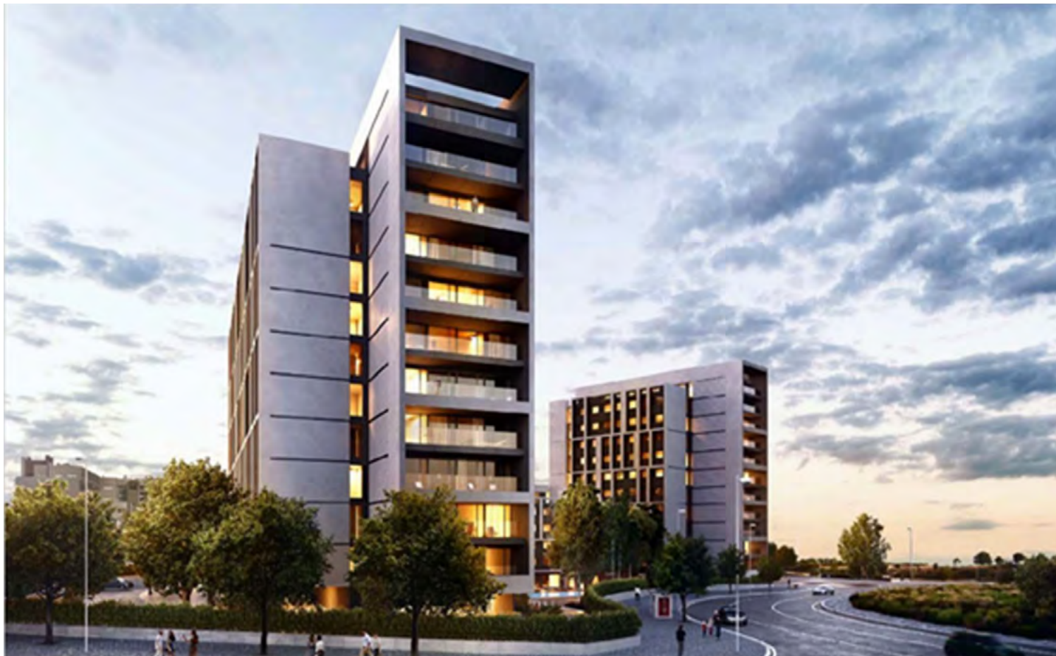
Recreación de dos de los futuros bloques de apartahoteles que se construyen en Las Cárcavas.