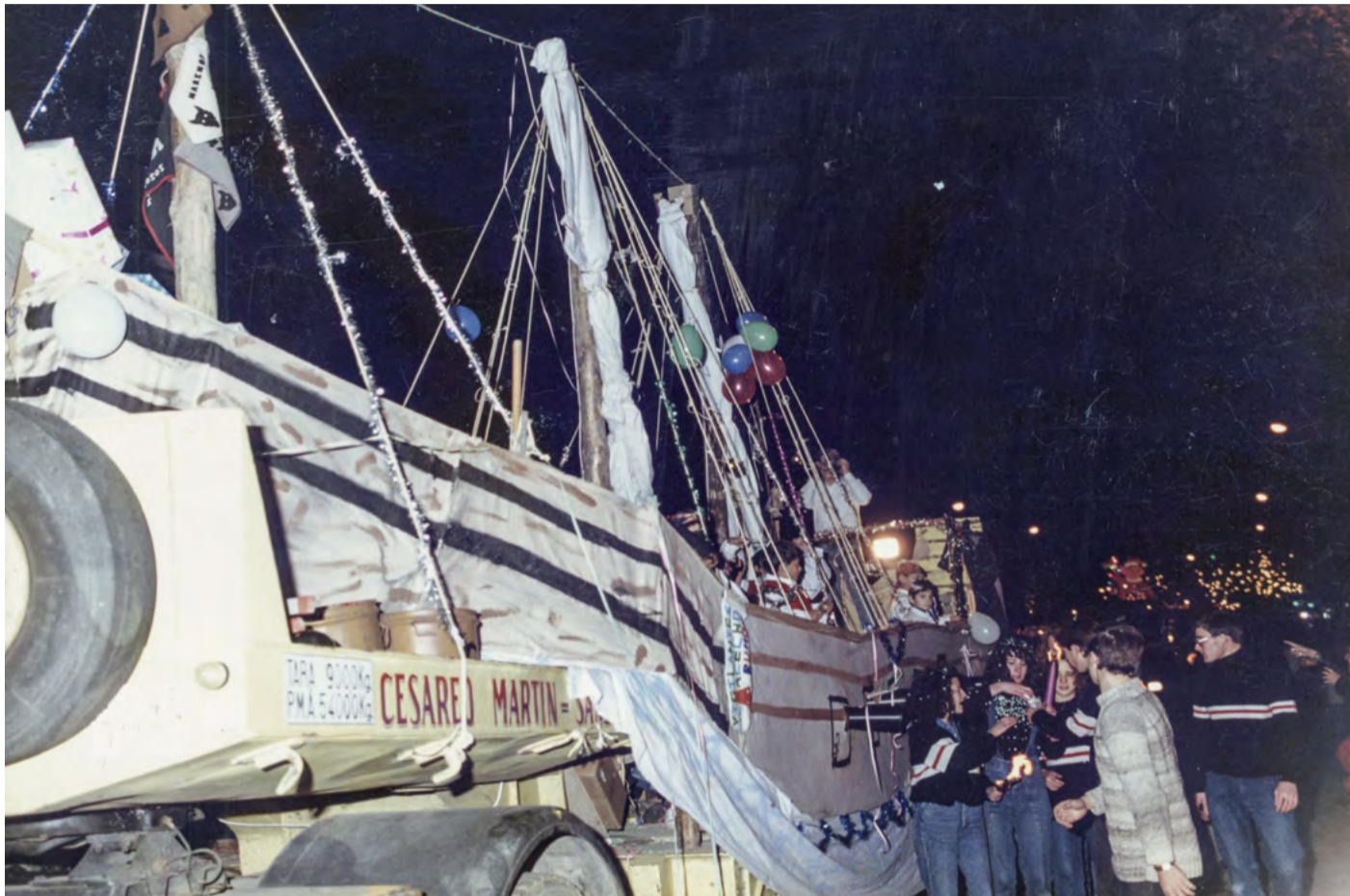
Carroza-barco de la cabalgata de Reyes organizada por la Junta Municipal de Hortaleza en 1990.

La coordinadora de la Cabalgata Participativa organiza una fiesta con una muestra de materiales donados por el vecindario que recogen la historia de uno de los eventos más queridos del distrito