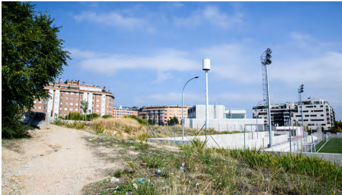
Solar en la calle Oña de Sanchinarro donde se pretende construir el centro deportivo de Sanchinarro. JAVIER PORTILLO

Todos los centros planificados tienen el mismo diseño, en el que se priman las piscinas cubiertas y las salas de musculación y de máquinas, potenciando las actividades dirigidas, y se eliminan las pistas para deportes colectivos, a pesar de que son una de las mayores demandas del vecindario. Además, se incluye la construcción de plazas de aparcamiento, que ocupan una buena parte de