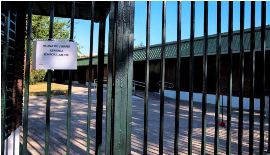
Cartel que anuncia las obras de las piscinas de verano del polideportivo Hortaleza y su cierre temporal. SANDRA BLANCO