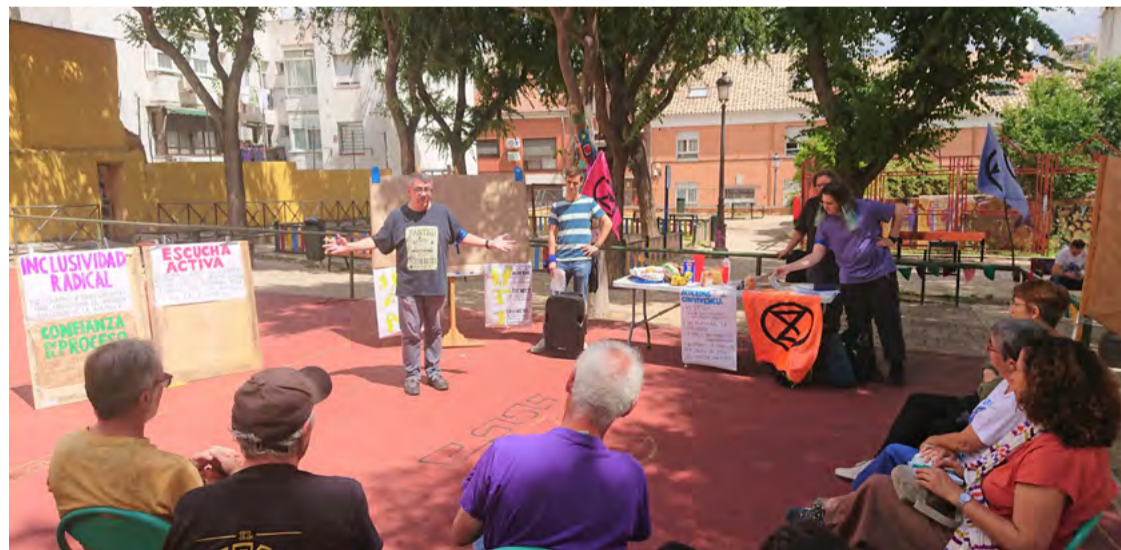
Asamblea popular por el clima celebrada en junio en los Jardines Josefa Arquer, en el casco viejo de Hortaleza.

El grupo madrileño del colectivo internacional Rebelión o Extinción, que promueve realizar una acción directa no violenta contra la crisis climática y ecológica que sufre el planeta actualmente, se establece en Hortaleza